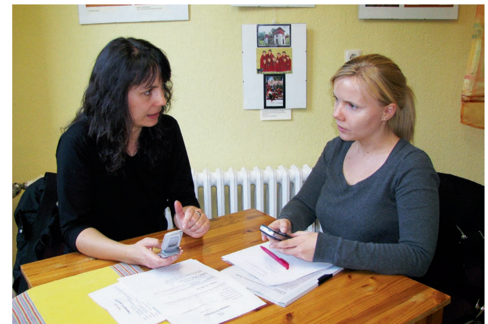
Sprachtutoren beim Erstgespräch