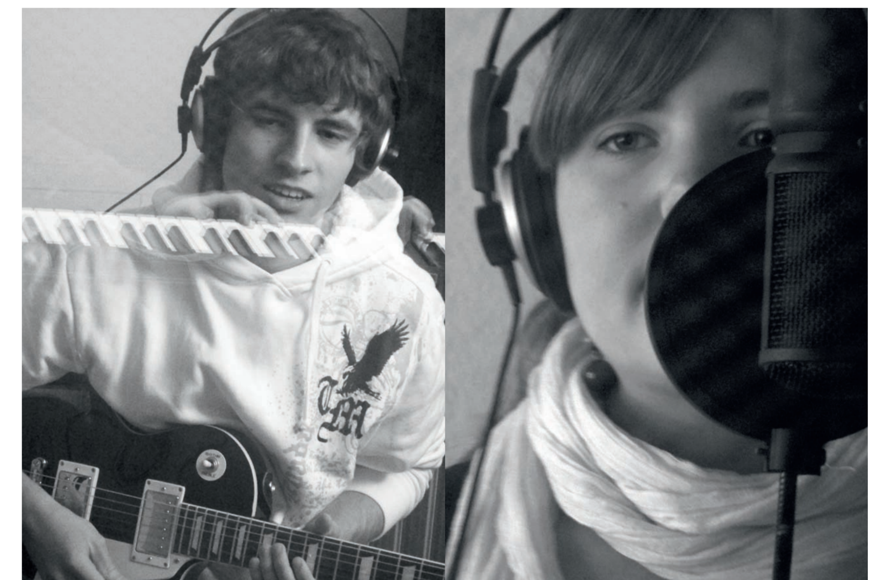
BEEED – Soundtrack zum Film